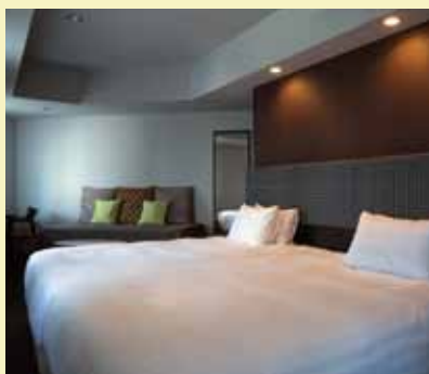
コーナー デラックスルーム Corner Deluxe Room (ツインルーム)