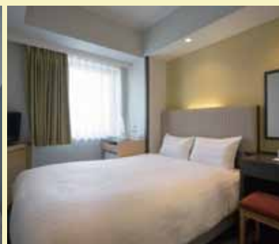
シングルルーム Single Bed Room ダブルルーム Double Bed Room